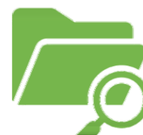
ANÁLISIS DE DOCUMENTACIÓN

Tanto el diseño de las técnicas de recogida de datos como el análisis con perspectiva de género de dichos datos se han realizado teniendo en cuenta los siguientes ejes de análisis: