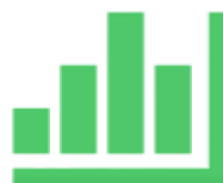
ANÁLISIS DE DATOS CUANTITATIVOS